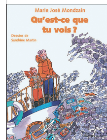
Qu'est-ce que tu vois ? (Gallimard)