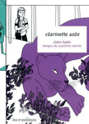
Collection Les Orpailleurs (Le Baron Perché)